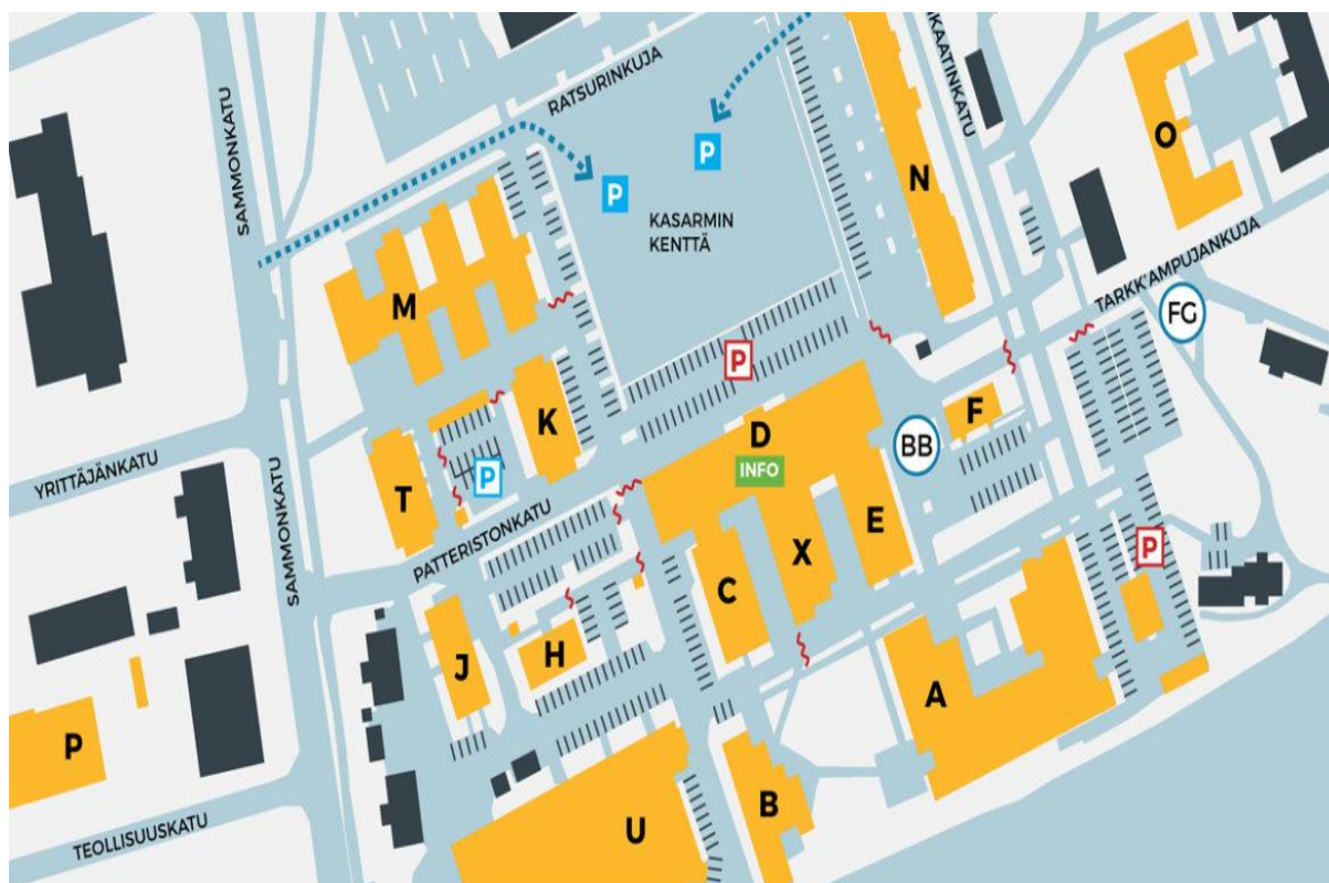
Kuva 1. Mikkelin kampus

Ammattikorkeakoulun käyttöön vuokrattuja tiloja Mikkelin kampuksella ovat A-rakennus 5 413 m 2 , CDEX-rakennus 13 403 m 2 , sekä osittain Mikpoli eli M-rakennus 3 254 m 2 sekä Puupoli eli P-rakennus 1 470 m 2 osittain. Lisäksi ammattikorkeakoululle on vuokrattu rakennukset B (Ravintola Kasarmina), H (hallinto), J (ympäristölaboratorio), K (toimistorakennus), O (oppilasyhdistykset) ja T (Ravintola Talli).